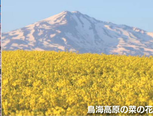
鳥海高原の菜の花